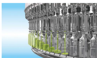
飲料・乳製品PETボトル無菌充填システム