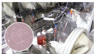
再生医療用細胞培養アイソレータ

した機器やシステムの長期安定稼働をサポートするアフターサービス、(3)幅広い業界で培われた先端技術の応用から”ダントツ製品”を生み出す技術力」と。