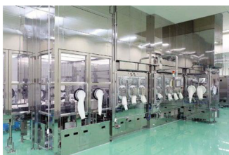
抗がん剤用無菌ハザード充填システム

1931年に創業した澁谷工業株式会社は、ボトリングとパッケージングシステムのリーディングサプライヤーであり、飲料、食品、化粧品、半導体、農業、ヘルスケア業界の顧客から絶大な信頼を得ている。当初は、酒蔵に用品を供給していたが、その後、洗瓶機、充填機、キャップ、ラベラ、ケーサ、パレタイザなどのボトリングシステムを製造し始め、1960年代初頭には1台の機械で180mlから1800mlまでの多品種の容器を兼用できる世界初のシステムを開発するなど、ボトリング事業での活躍の場を拡大していった歴史を持つ。