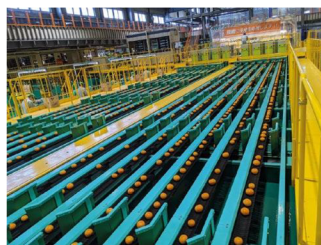
農業製品用選果選別システム

また、シブヤでは、グループ以外のパートナーとの協業も重要視しており、特に医療分野における規制に関しては、微生物学とバリデーションの専門家、米国非経口薬物協会(PDA)の元会長であるジェームス・エイカーズ博士、日本における無菌操作及びGMPの専門家である佐々木次雄博士、厚生労働省など、複数のステークホルダーと提携・協力している。さらに、同社は、佐賀大学発ベンチャーの研究者と再生医療用のバイオ3Dプリンターを共同開発し、山口大学と新しいタイプの肝臓再生療法にも取り組んでいる。